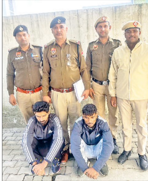
सोनीपत। पुलिस की गिरफ्त में आरोपी युवक।