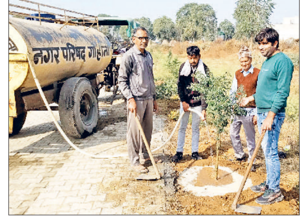
गोहाणा। पौधारोपण करते संगठन के सदस्य।