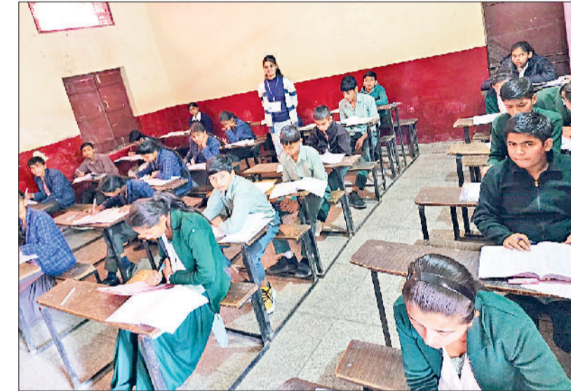
सोनीपत। रामजस स्कूल में परीक्षा देते हुए परीक्षार्थी।