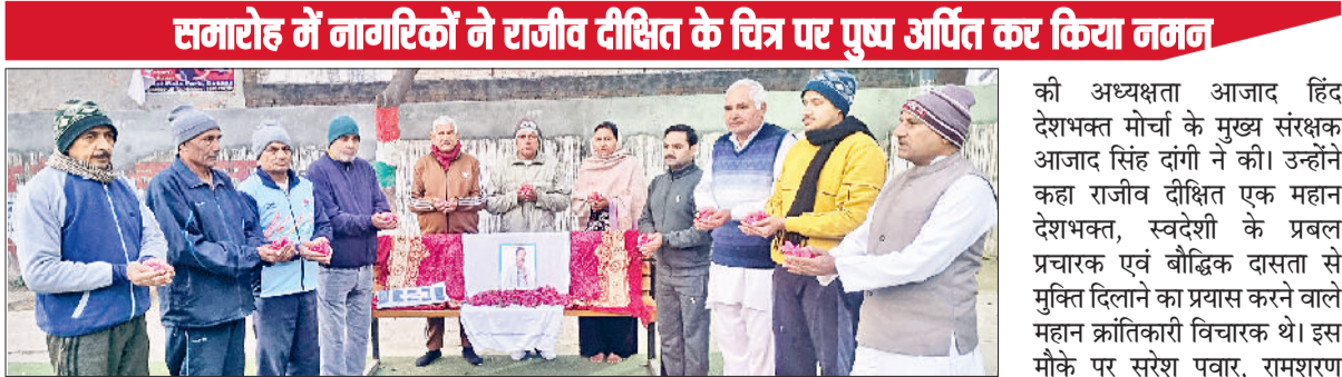
गोहाणा। राजीव दीक्षित के चित्र पर पुष्प अर्पित करते हुए नागरिक।