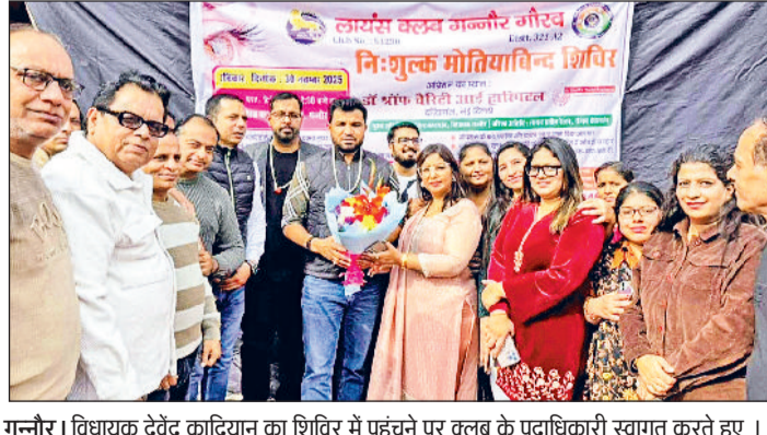
गन्नौर। विधायक देवेंद्र कादियान का शिविर में पहुंचने पर क्लब के पदाधिकारी स्वागत करते हुए।

लायंस क्लब गन्नौर गौरव की ओर से रविवार को शहर के शिव पार्क में निःशुल्क मोतियाबिंद जांच शिविर का आयोजन किया गया। शिविर का शुभारंभ बतौर मुख्य अतिथि विधायक देवेंद्र कादियान ने रिबन काटकर किया। विशिष्ट अतिथि के रूप में लायन प्रवीन रेलन मौजूद रहे। शिविर में विशेषज्ञ चिकित्सकों की टीम ने करीब 213 लोगों की आंखों की जांच की। जांच के दौरान 37 लोगों में मोतियाबिंद के लक्षण पाए गए हैं। वहीं, क्लब की ओर से मौके पर ही 135 जरूरतमंद रोगियों को निःशुल्क चश्मे व दवाइयों वितरित की गईं। विधायक देवेंद्र कादियान ने कहा कि लायंस क्लब ने क्षेत्र के जरूरतमंद लोगों के जीवन में रोशनी बिखरने का सराहनीय कार्य किया है। उन्होंने कहा कि समर्थनों का यह सामूहिक कर्तव्य है कि वे जरूरतमंदों की सेवा करें। मानव सेवा से बढ़कर दुनिया में कोई दूसरा धर्म नहीं है।